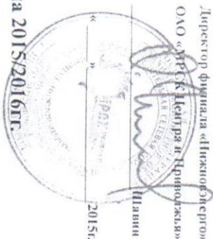
ГРАФИК ограничения режима потребления электроэнергии на 2015/2016гг. по ОАО «Верхне-Волжская энергетическая компания».